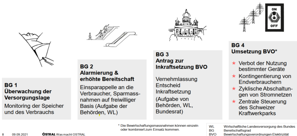
Abbildung 1: Mehrstufiger Prozess bei länger anhaltender Strommangellage